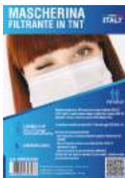
VERSIONE PER ADULTI