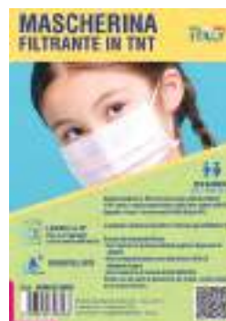
VERSIONE PER BAMBINI